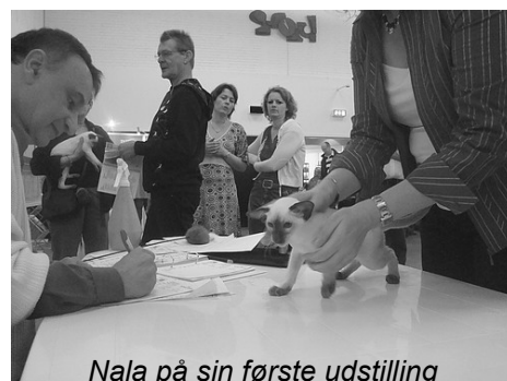
Nala på sin første udstilling