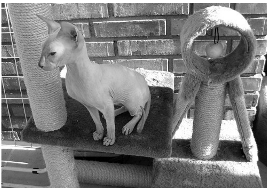
FIN*Birregin No Doubt PEB b 21 33 er ud af det førstfødte Peterbald kuld i Finland