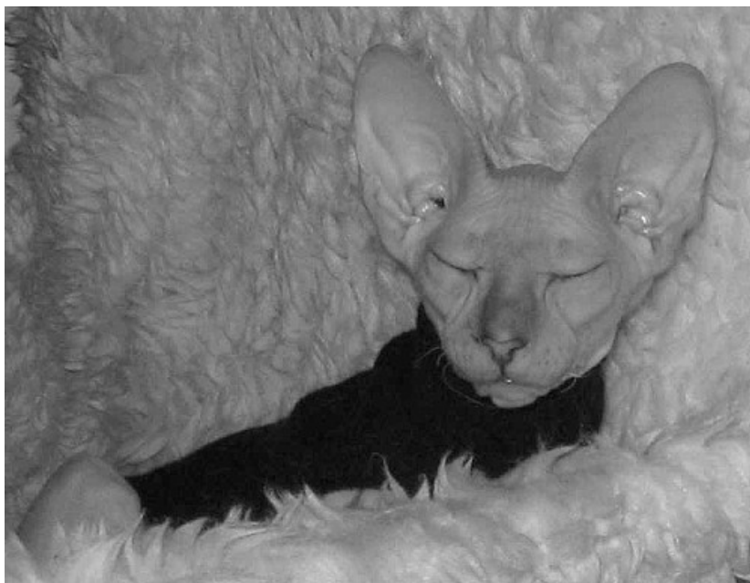
"Rynkes" forældre kommer fra Rusland IC Leland Maxim del Iris og Annabelle del Iris

Hen over vinteren satte hun dun på hele kroppen, og jeg var lidt skuffet. Jeg håbede i mit stille sind, at det