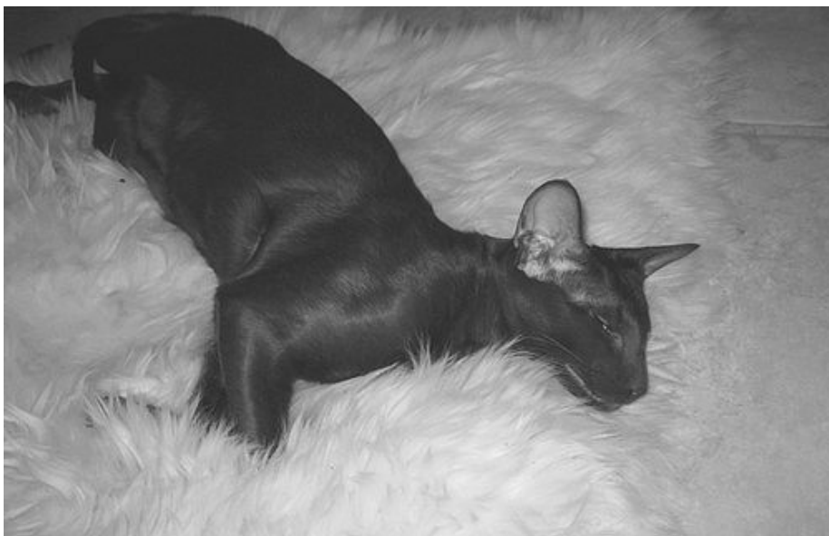
DK Nissens Young — Havana Orienter