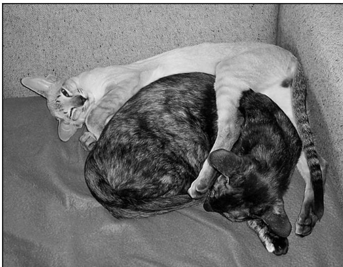
Romeo og Rose, fra før verden gik af lave

Jeg hentede ham og faldt med det samme for den lille sribede chokoladekaramel med de store ører, det charmerende fipskæg og den insiste-