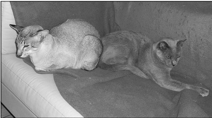
Det sker, at Lurifax og Romeo glemmer, at de ikke er perlevenner

lå rystende af angst under sofaen, når han da ikke lige tømte sin blære på helt ureglementerede steder. Brunne og hvide hårtotter i ufredelige bunker kunne spottes rundt omkring. Jeg var chokeret og søgte råd her og der, men midt i det hele åbenbarede der sig pludselig den mulighed, at han kunne få et nyt hjem. Han blev tilbudt bofællesskab med en enlig kastrat, hvor han heldigvis hurtigt faldt til og blev sig selv – en rar og venlig kat, som jeg holdt meget af. Jeg har aldrig brudt mig om at omplacere katte, men jeg blev nødt til at revurdere min holdning, for det var uden tvivl den bedste løsning, om end den kostede spandevist af tårer. Samvittighedskvaler og følelsen af at have svigtet gjorde min fjerdragt så våd og tung, at