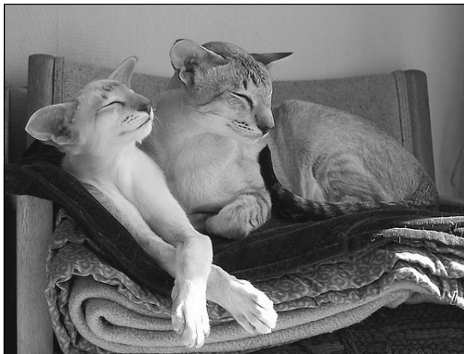
Talisker og Romeo

rende spinden. Hjemme gled han ubesværet ind i flokken, og Romeo accepterede ham fra første øjeblik og har lige siden omfattet ham med rørende faderkærlighed. Talisker kan lide alle, og alle kan lide ham.