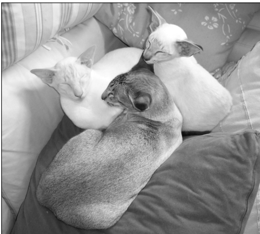
Cherubino og Romeo har taget godt imod lille Talisker

Der var flere damer på vej, og Romeos selvfølelse voksede. Et ulmende fjendskab mellem min unge russerkastrat og Romeo voksede også og brød ud i lys lue, da de pludselig kom op at slås. Siden kunne de ikke være i samme rum, og jeg lod opsætte en netdør midt i huset, så de kunne holdes adskilt. Situationen var uholdbar, for de sad på hver sin side og lurede på den mindste lejlighed til at slås videre. I min fortvivlelse ringede jeg til en veninde, om hvis datter jeg vidste, at hun elsker russian blue. Og som en gave fra himlen ville hun og hendes mand og deres to drenge med kyshånd modtage min lille elskede russer. Mere kval og flere tårer, men