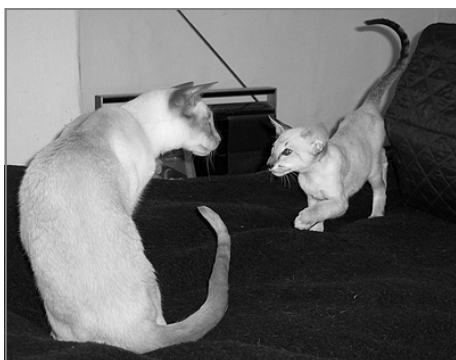
Herkules møder Parsifal første gang

Derved kom Parsifal ind i mit liv, og ham fik jeg 12 lykkelige, lillamaskede år med. Jeg ville aldrig have troet, at en kat kunne være som ham, hvis ikke jeg selv havde oplevet det. Han var den personificerede godhed over for alle andre katte. Sig selv og sin egen bekvemmelighed satte han uden mindste tøven til side for at beskytte enhver, der var svag og trængte til trøst og omsorg, og det var rørende at se, hvordan han som en selvfølge tog ansvaret for en ny killing, når en sådan ankom. Min søster var så fascineret af denne ekstremt kærlige kat, at hun forestillede sig, at han – når situationen krævede det – rejste sig på to ben og som en anden Robin Hood spændte sin bue og forsvarede de svage.