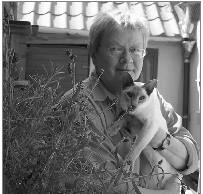
Lise med Smukke Siam's Lilla Parsifal

En stor personlighed var han, og det faldt mig helt naturligt at fejre hans 1- års fødselsdag med fin middag og indbudte gæster, der havde taget pænt tøj på og hver især skrevet en festsang til ham. Derved startede en