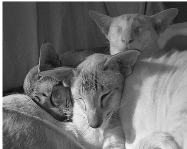
Drillebanden: Romeo, Talisker og Cherubino