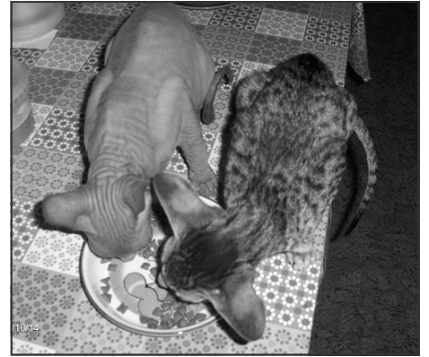
"Spotter" med sin legekammerat "Sky"