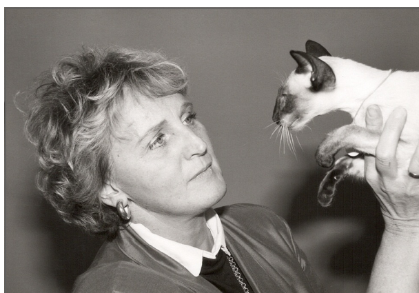
Kis Østerby med Klingskovs Piperi SIA n fra 1988