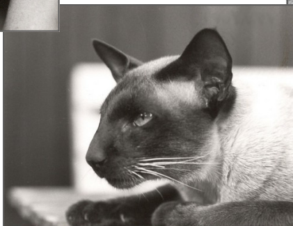
San-T-Ree Dark Mascot SIA n