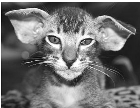
Coco Chanel Draquila OSH n 25 fra 2009

Hmmm... er der stor forskel? Nej, det tror jeg ikke, men i 80'erne og 90'erne var det mere almindeligt med 2 dags udstillinger, og stewarderne præsenterede kattene for dommerne. Men jeg elskede udstillinger dengang, og jeg elsker udstillingerne nu. Hvordan oplever du stemningen blandt udstillerne?