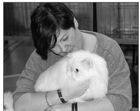
Dommeruddannelse i kat. I

Jeg har selv været med til at opdrætte og udvikle vores race på godt og ondt. Jeg har lavet mange ekstreme katte, men normalt er det ikke dem, der lever længst eller producerer de smukkeste katte. Jeg har valgt at nedprioritere typen lidt (eller størrelsen af ørerne), fordi jeg vil have bedre øjenfarve, og jeg har konsekvent brugt katte med god øjenfarve, for den er meget vigtig for mig. Jeg kan