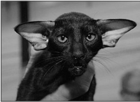
WW'11'10 SC Coco Chanel's V For Vendetta, JW OSH n

også rigtig godt lide store og elegante katte, så jeg har derfor anvendt de linjer, jeg ved besidder disse egenskaber. Noget vigtigt at nævne om kategori IV kattene i dag er, at ALLE kattene har et super temperament, sådan var det ikke i 80'erne. Dengang var der meget lyd omkring kategori IV kattene, og det var så almindeligt, at folk troede at de skulle være sure.