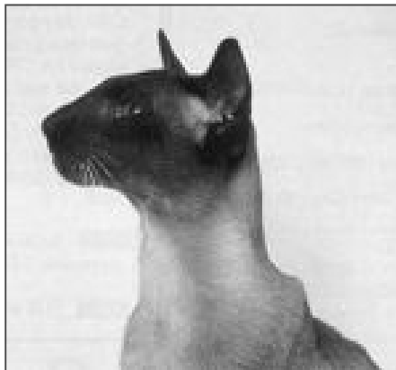
Dapper-Dillons ZZ-Top, SIA n