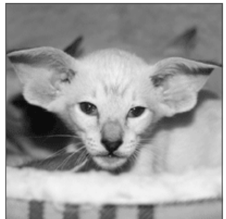
Coco Chanel China SIA n 21, fra 2008

Men det er det, der passer til mig og mit opdræt, og hvad andre gør, er op til dem.