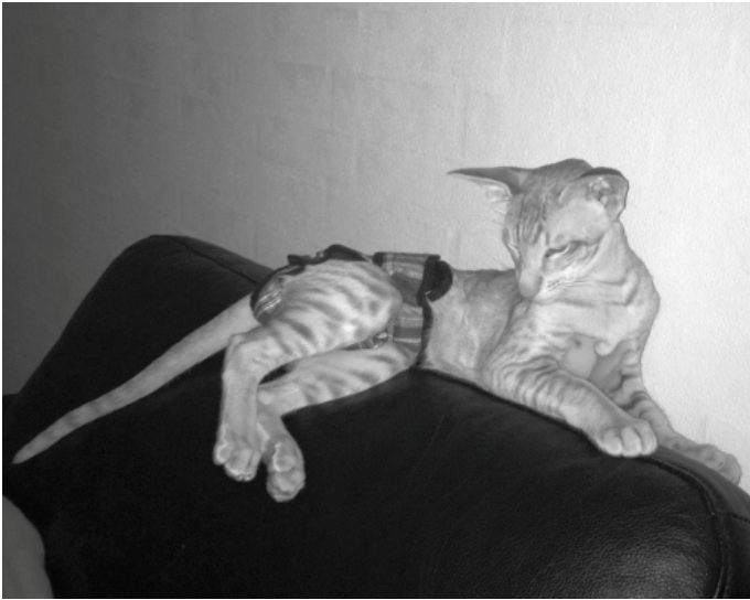
"Manse" med hankattebuks i designermodel

og forsøger at parre, så der er ingen tvivl om, at han snart er klar. I mellemtiden går vi og krydser fingre og tæer for, at han ikke begynder at strinte. Vi har nemlig ingen hankattefaciliteter – så det er og har aldrig været meningen, at han skal gå som "rigtig hankat".