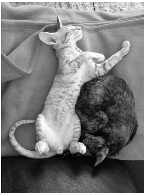
Ung og uskyldig

Jeg havde ikke været i opdrætsverdenen ret længe og kendte ikke så meget til de besværligheder, der nogle gange kan være med at holde hankat, og det var måske meget godt, for så tog jeg bare tingene, som de kom. Det viste sig, at jeg nok var lidt hel-