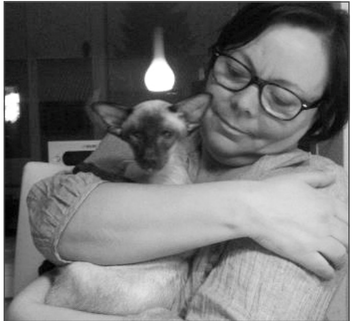
Åmand hos Beth

Morgenritualet blev udvidet med en halv times kælen med Åmand. Ting, som før var hurtige og nemme, blev pludselig en del mere komplicerede. Hvis jeg strøg et stykke tøj, havde jeg Åmand på brættet eller i ledningen. Syede jeg på min symaskine, sad Åmand bagved maskinen og holdt