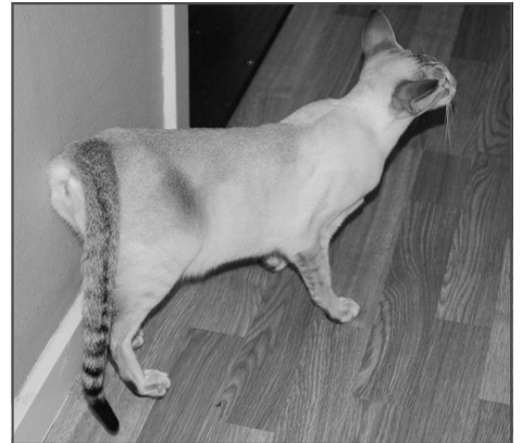
Karakteristisk adfærd for en hunkat i løbetid

Mange mennesker mener, at det er naturligt for hunkatten at have killinger, og det derfor er synd at fratage den denne mulighed. Det skal hertil siges, at kattens trang til at reproducere sig er rent hormonelt styret og fjernes hormonpåvirkningen, ophører denne drift. Man bør heller ikke overse, at drægtighed og yngelpleje under alle omstændigheder er både en fysisk og psykisk belastning for hunkatten, og at ikke alle er lige gode mødre.