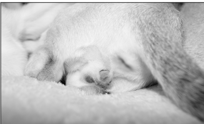
Kun to små snit at se dagen efter kastrering på 14 uger gammel killing

4) Opdrætterne har ved tidlig neutralisation også fuld kontrol over, hvilke dyrlæger der foretager indgrebet.