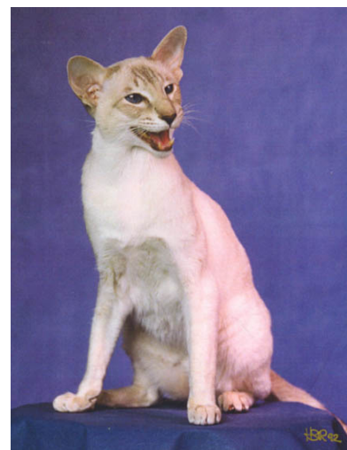
EC. (N)Hesno-Briom's Cutty Sark, SIA c21

Sark blev brugt til mange forskellige hunkatte, også "ud af huset", idet vi synes det var vigtigt for racen at flere opdrættere kunne få nogle af de