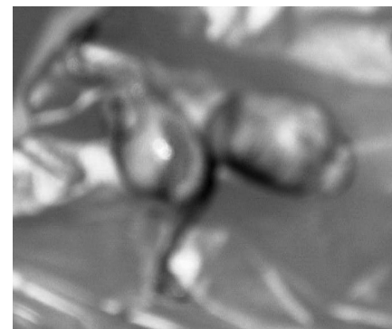
Og her er „gevinsten“.

hensigtsmæssigt, at du får din kat øretatoveret, når den alligevel er i narkose.