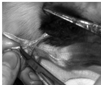
Sædstrengen klippes over.