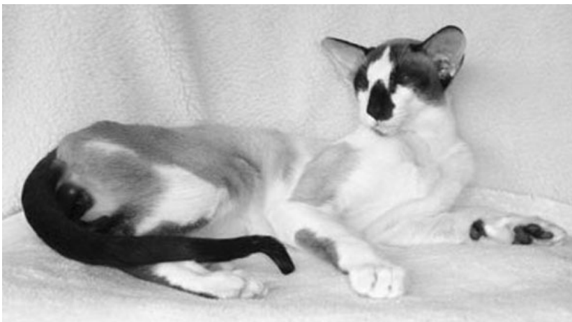
El Shaklan Vae Victis, Seychellios Korthår