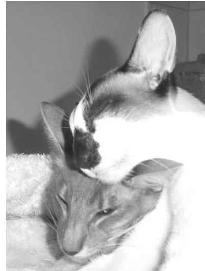
Af sind er Seychellios ligesom dens søskenderacer