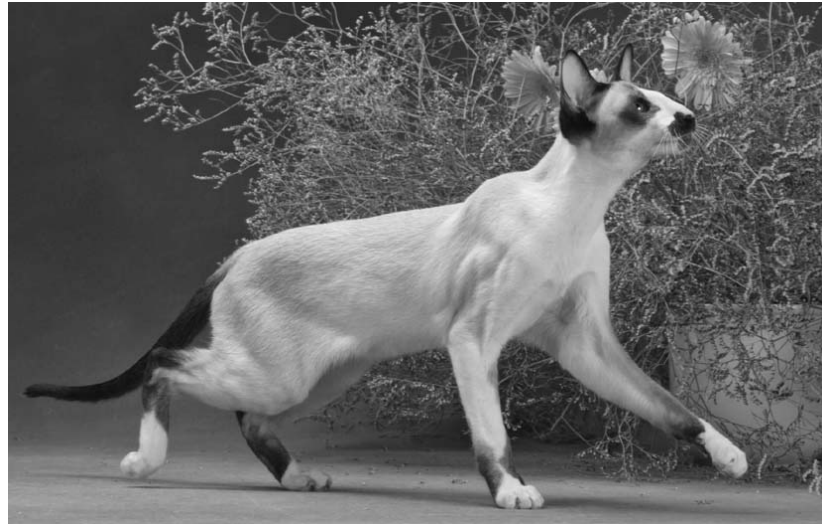
El Shaklan Valmiki, Seychellios Korthår som voksen