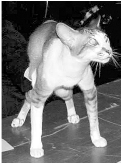
Tabbymasket m. hvid

er Siamesere med blå øjne og points under det hvide, så måtte de også være Siamesere - det hvide mønster er "kun en farve".