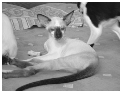
El Shaklan Varg, Seychellois Korthår

Efter en afstemning om, hvorvidt man kunne sætte forslaget til afstemning i den ændrede form, stemte FIFé's generalforsamling for det nye forslag, og dermed har vi pr. 1/1 2006 fået 2 nye søskenderacer: Seychellois Shorthair (SYS) og Seychellois Longhair (SYL)