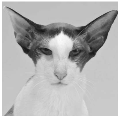
Shah du Soleil Noir, Seychellios Korthår