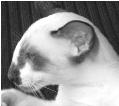
Felides Vivres Furrune, Seychellios Korthår

linie også med en rex-linie. Hun havde en lilla spotted Orientaler hunkat uden siamesergen, som parret med en amerikansk importeret sort/hvid Cornish Rex ved navn May-iks Chiandre gav 2 bicour killinger. Den ene var en blå/hvid hunkat ved navn Felides Vivres Puss-Tel, som senere blev parret med Gr.Int.Ch. Procul Harums Pretzel Logic. De fik et kuld på 4 bicour killinger, heraf en blå/hvid hunkat ved navn Felides Vivres Whis-Purr, der senere blev parret med Purrkins og dermed kombinerede de 3 forskellige linier.