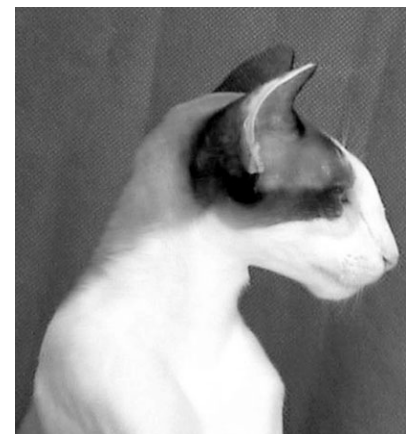
Shah du Soleil Noir, Seychellios Korthår