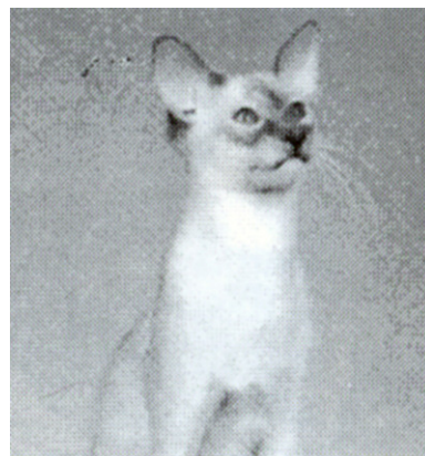
GRC Balik's Bolshoi of Purrmatrix, BAL c

I 1974 læste Mrs. Sandra Birch fra det sydlige England en artikel om en ny katterace, der var kommet til England fra