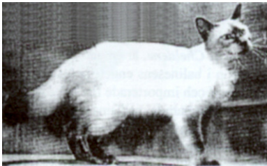
GRC Ti-Mau's Szabo Aki of Die Lilo, BAL a