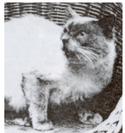
Verdes Blue Warrior of Davina, BAL a (første Balineser i England)

USA, og hun blev interesseret. Hun kontaktede kattens ejer, men fik at vide, at hun ikke kunne skaffe en ny kat lige på det tidspunkt. Til hendes store overraskelse blev en af kattene, en varianthun, alligevel leveret på hendes adresse, og kort efter ankom der også en balineser han, Verdes Blue Warrior of