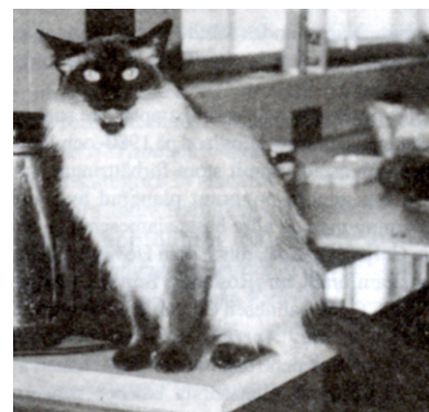
Gr. Pr. Dhikala Belfreya, BAL n

Den tredje balineser, der blev Grand Champion, var en rødtabbymasket han, Soleil Imperial Rufus, et barnebarn af siameseren Sup. Gr. Ch. Zachary Apollo. Rufus, der er født i 1988, tog sin titel i 1990 og var senere også den første balineser, der fik titlen UK Grand. Den første hunkat, der opnåede den ærefulde Grand-titel, var den vidunderlige Gr. Ch. Aprikat Snow Spangles,