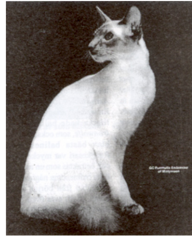
GRC Purrmatrix Endeavour of Mistymoon, BAL C (Bedste Balineser i CFA 1992/93)

som blev gjort af Sylvia Holland (stamnavn Holland's Farm). Miss Holland var emigreret til USA fra England og hun slog sig ned i Californien, hvor hun arbejdede for Walt Disney (hun siges at have lavet animationerne til dele af Disney-filmen "Fantasia").