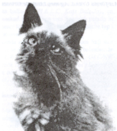
Sandoval Paris Review, BAL a

Til at begynde med blev balineserne dømt sammen med andre langhårede racer på de engelske udstillinger. Man begyndte at frygte for, at balineseren aldrig ville gøre fremskridt og nærme sig siameseren i type, men at den i stedet ville vedblive at være en svagt perserlignende semilanghårskat med blå øjne, medmindre racen fik lov til at blive dømt i samme gruppe som siameserne i stedet. De langhårsdommere, der dømte balineserne, manglede kendskab til siameserstandard. (Ved en enkelt lejlighed havde dommeren der hvor der på dommersedlen står "Hoved" bare skrevet kommentaren : "Yes".....)