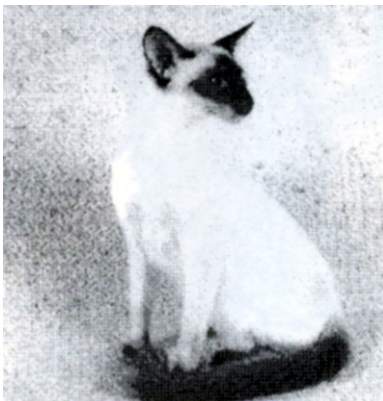
GRC Purrmatrix Suzie Q, BAL b