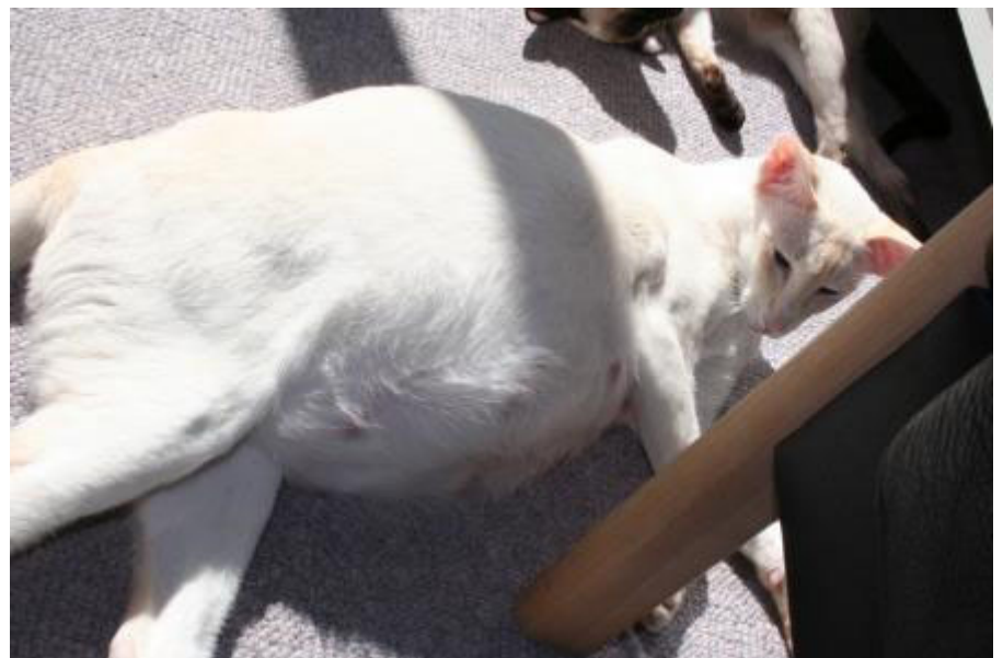
En højgravid Menja...der kom 9 killinger.