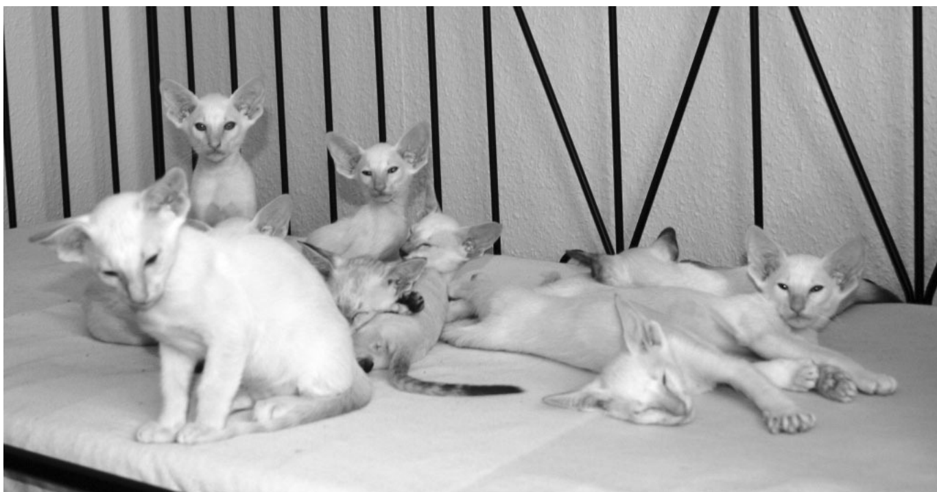
Menja's 9 dejlige killinger

Menja er nu 5 ½ år gammel og styrer katterflokken med streng pote. Hun har altid været den dominerende kat i flokken, men på den gode måde. Hun er eneregent og blander sig kun sjældent med sine undersåtter. Er der ballade blander hun sig og deler lussinger ud. Og når der soves, ligger pøblen sammen, mens hun ligger i arm hos sin elskede menneskemor!