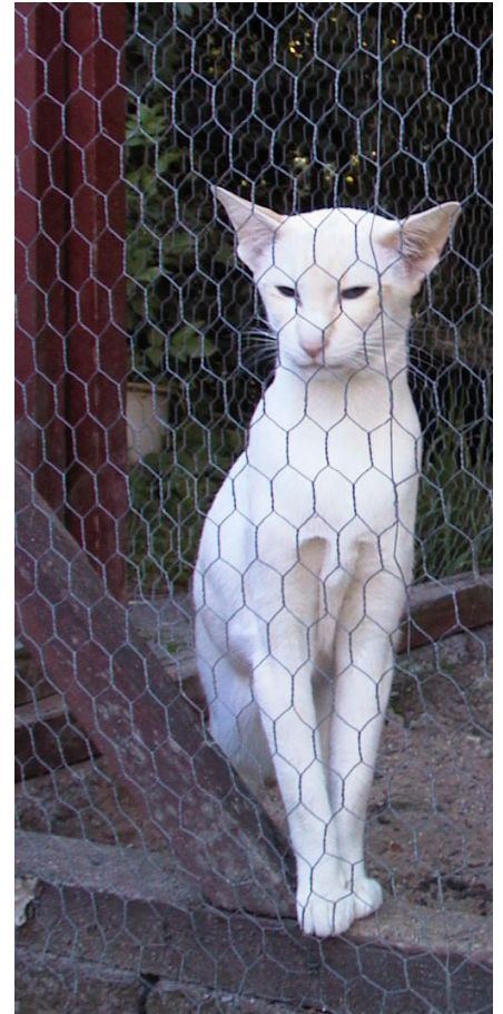
Menja i løbegården

Et andet liv brugte hun en dag, da vi skulle male kældergulv med to-komponent-maling. Det