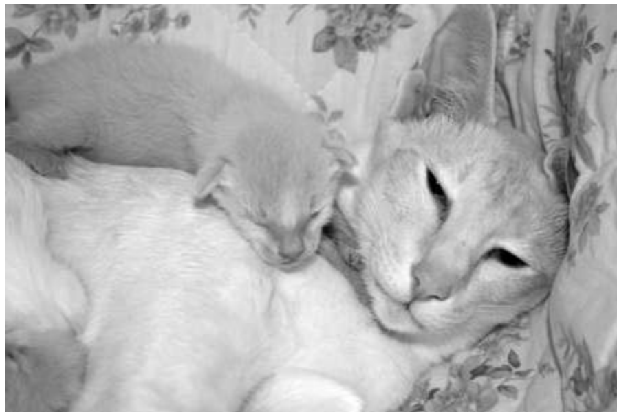
En omsorgsfuld mor

er skrappe sager og stærkt ætsende! Hun så os arbejde og skulle så hilse på. Med et stort spring sprang hun direkte i det malede, gled så hun landede med hele den ene side smurt ind i maling. Resolut tog jeg katten og løb på badeværelset og skyllede hende et kvarter med rent vand. Hun reddede endnu engang livet, men hvor så hun ud. Hele den ene side var fyldt med stivnet maling, som var umuligt af få af. Sådan så hun ud ret længe, lige indtil hun selv fik malingen revet af i totter. Hun satte også sine poteaftryk med maling på vores fliser i brusekabinen, de er der stadig!