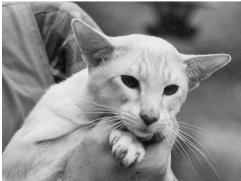
EC(N)Hesno-Brioms Cutty Sark

sværre fik vi ikke beholdt en af killingerne i tide. Hun måtte steriliseres efter en livmoderbetændelse og er nu en tyk og glad kastrat.