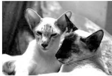
Rambo (th) og Chianti

hun fik et kuld på 3 hanner sidste år. Samtidigt viste det sig at søsteren Jala-Jala nu pludselig alligevel var blevet gravid. Hun fødte 2 hanner