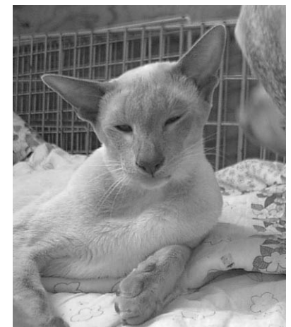
GIC FIN*Arhantin Midas