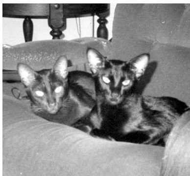
Rolle og Lilleskrig

Efter et besøg i Norge fik vi IC (N)Hesno-Briom's Tortie Riccadonna (Rambo) med hjem til en parring med Sark. Desværre skete der det kedelige, at den norske opdrætter (der jo også var Sark's opdrætter) døde mens vi havde Rambo boende. Derfor endte det med at vi beholdt Rambo og hun fødte sin enlige killing her hos os: Battlefield's Chianti Classico (sia b 21) som altså er næsten helt norsk. Chianti fik 2 kuld, men de-