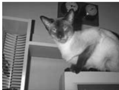
S*Humlaåsens Chocolate Chip

I sommer hentede vi en bruntabby-masket hunkat i Sverige: S*Limerick Xantippe (Tippe) som vi glæder os til at bruge i avlen for at nærme os