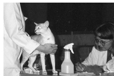
Sark på World Show

I år 2000 kom så vores nuværende hankat: GIC FIN* Arhantin Midas, som i sin stamtavle har flere af de katte vi igennem årene havde fået interesse for. Vi må da også lige huske vores to "sovekammerkatte". Vi fik tilbudt at overtage Dejbjærgs Nausikaa (sia g 21), da opdrætteren ville stoppe med at opdrætte. Hun blev parret med Sark og fik en lille hunkilling: Ch. Battlefield's Blue Petruska