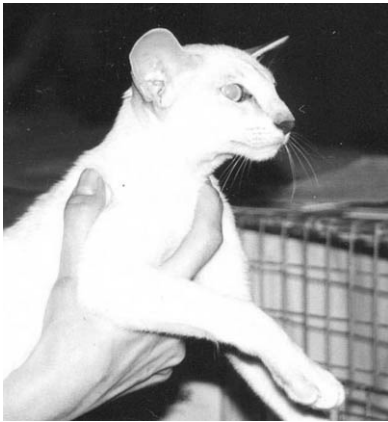
Ch. Battlefield's Fit for Fight

selskab og skal altid ligge på min hovedpude om natten. De er nu henholdsvis 11½ og 9 år.