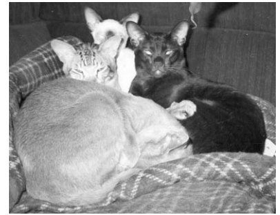
Heidi, Masse, Mylds og Snøvsi

Endnu engang har vi fornøjelsen at bringe et opdrætterportræt - da vi i dette nummer har tabbytema, synes vi det var relevant at bringe portræt af opdrættet Battlefield's der har ejet, opdrættet og importeret op til flere tabbymaskede siamesere. God fornøjelse.