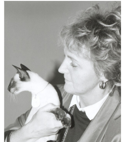
Kis Østerby m. Klingskov's Piperi

Vi blev medlemmer af en katteklub (JYRAK) i 1974 på klubbens 40 år's jubilæumsudstilling i Faaborg. Snart