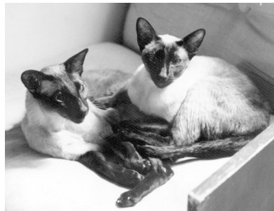
Klingskov's Lambda og Klingskov's My, 1981

For os er det blevet anderledes, vi har fra starten kun ønsket os siamesere med rene siameser-linier. Det er efter hånden blevet en mangelvare, så at finde det rigtige avlsmateriale er nu blevet meget indsnævret.