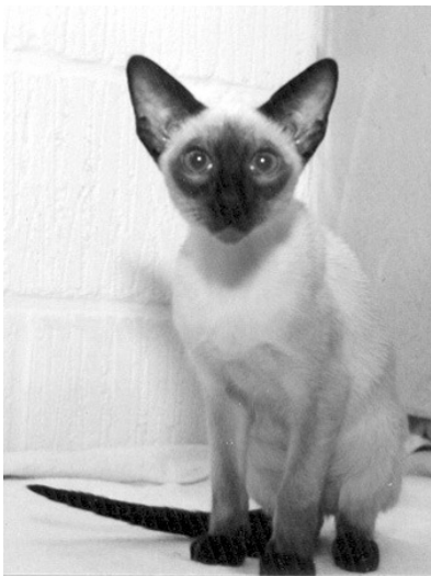
Klingskov's killing ca. 1980

Er der andre ting du har lyst til at fortælle i forbindelse med dit jubilæum?