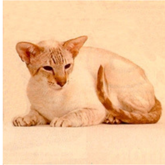
Sup.UK.Gr.Ch. Tabbra Bon Chance