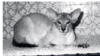
Gr Ch Shermese Tigers Eye