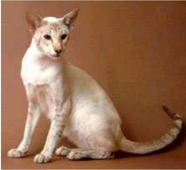
Sup.Gr.Ch. Zachary Apollo