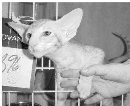
„Bimse“ som 3 mdr. killing