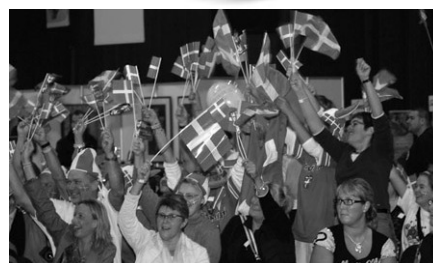
Rød/hvide farver...