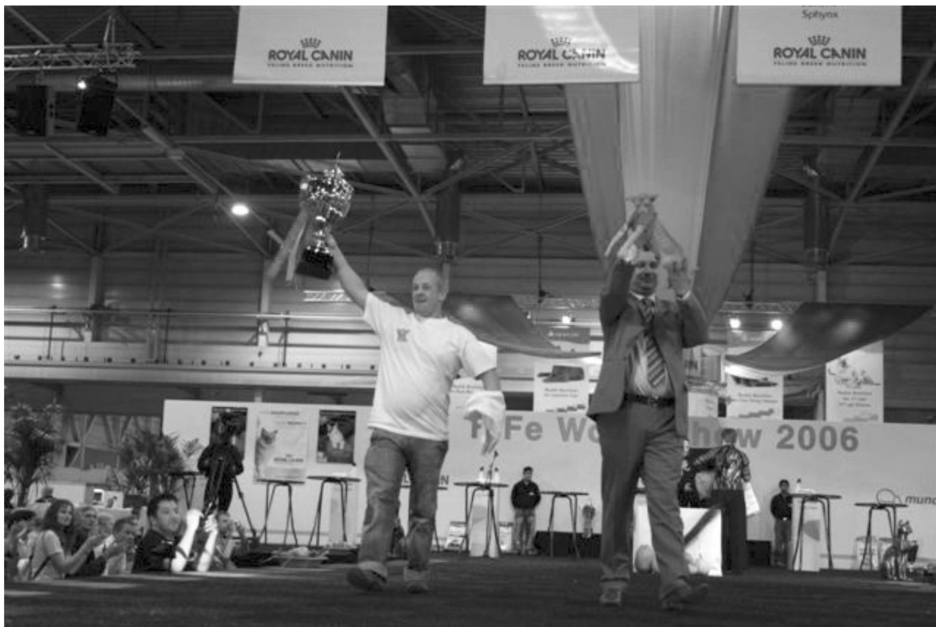
Her præsenteres WW06 FIN*Anatolian Me too JW, på scenen. Flot gået!!