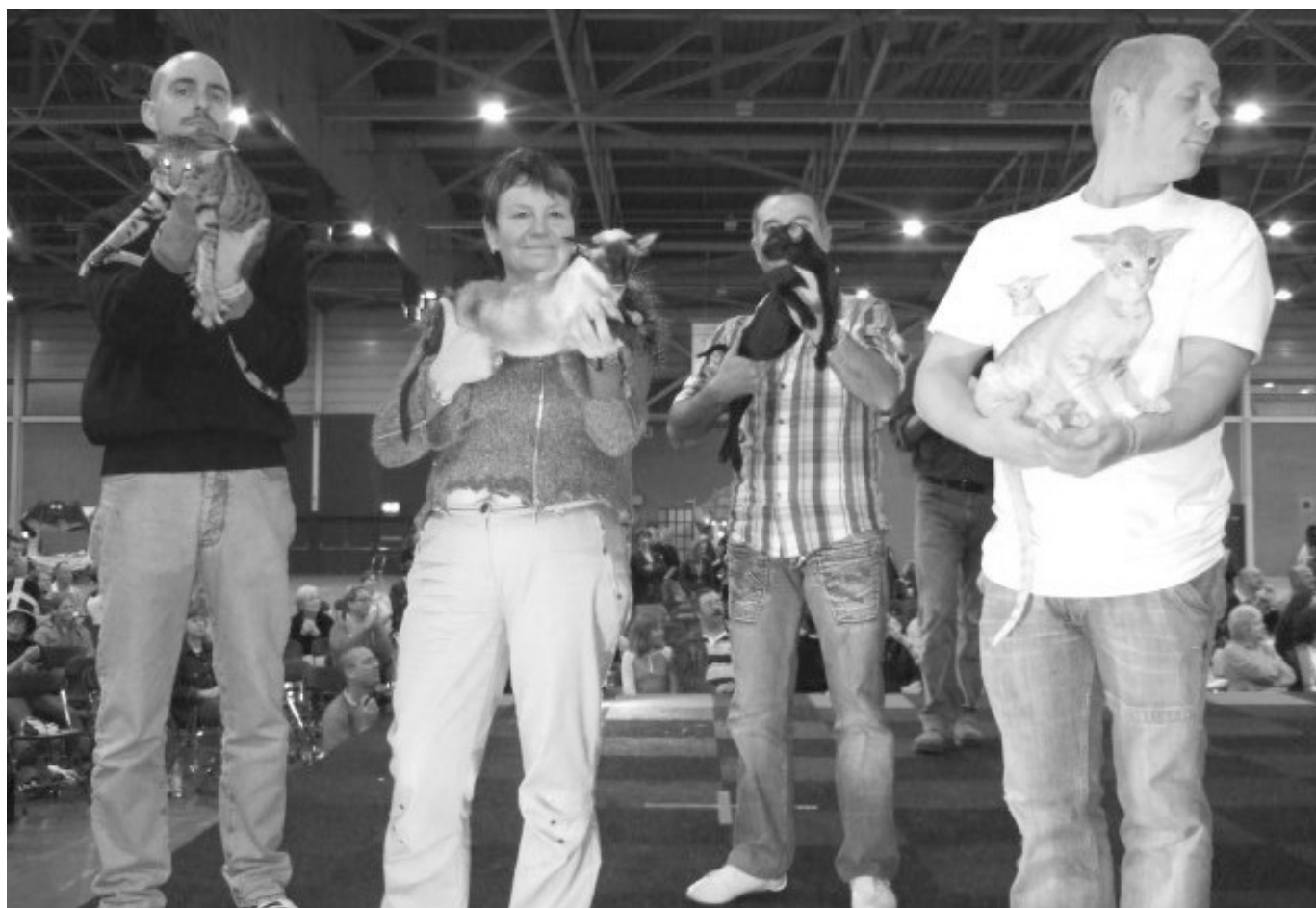
Fra venstre mod højre: WW06 Ungdyr, Michelangelo D'Oltremare, WW06 hunkat My Squaw v. Warantharpa, SIA n WW06 killing Los Califas Hatim & WW06 Hankat FIN*Anatolian Me Too.