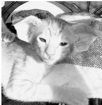
„Bimse“ som 8 ugers killing