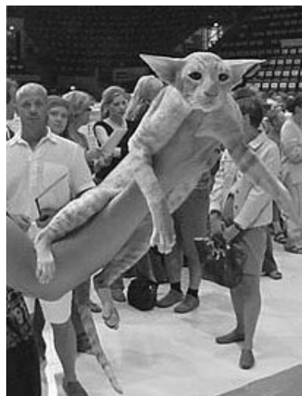
„Bimse“ på udstilling i Helsinki

Når udstillings tasken kommer frem, han er altså ikke dummere, end at han ved, det er hans taske – så er han klar og sætter sig ude ved hoveddøren og