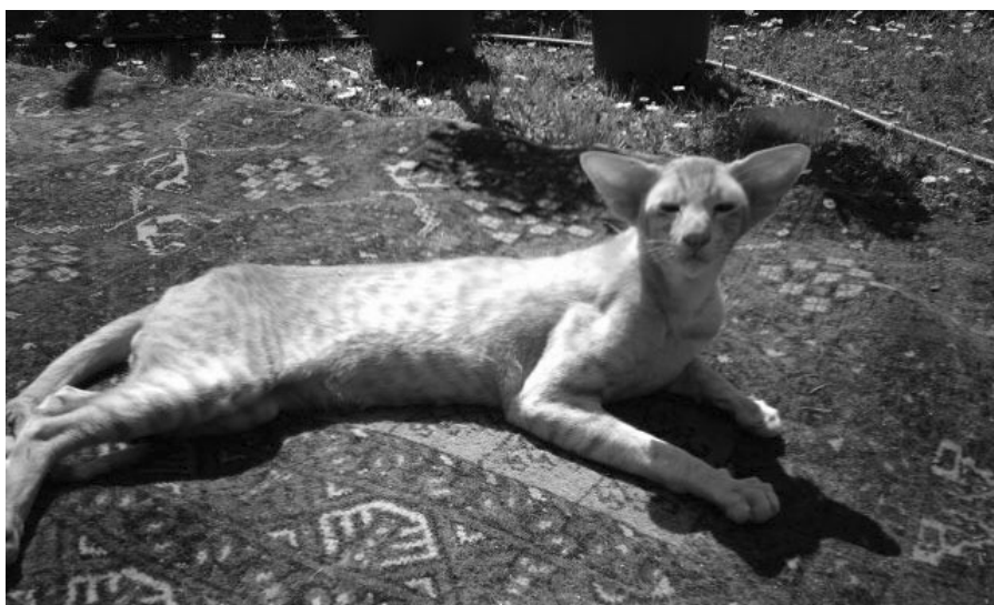
„Bimse“ nyder sommervarmen

Bimse kan ikke være isoleret – vi har ikke engang prøvet. Den dag han bliver højfertilt – HA!! – og er ude af stand til at trives her blandt