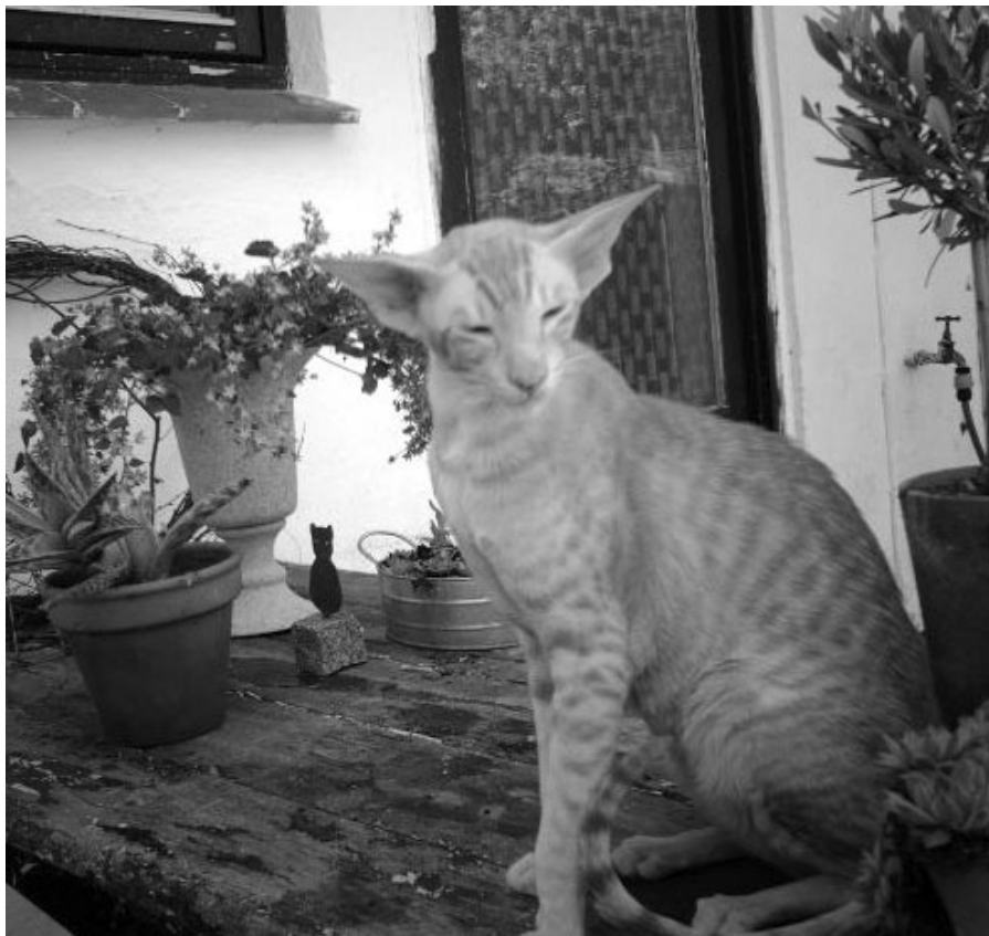
„Bimse“ Maj 2006

alle kastraterne og hunnerne uden at lave ballade, bliver han kastreret pr. omgående.