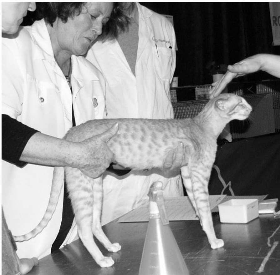
„Bimse“ på udstilling i Arnhem

men hvis jeg sådan var sikker, så ville hun da være rigtig glad for at han skulle bo hos os, så..... Bimse kom til Danmark, og nøj, hvor er vi glade for ham !! Han er en forfærdelig glad og ukompliceret hankat. Eller hankat er måske så meget sagt – måske mere som en kastrat.